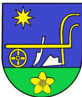
Erb obce Bogliarka